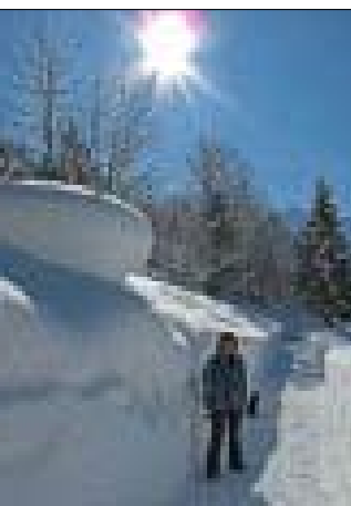
Erkunden Sie mit Ihrem Hund den Harz

KONTAKT: Top Mountain Tours GmbH, Sankt Jakob Straße 15 D-82319 Starnberg-Landstetten, Tel. 0049 (0) 8157 924548 info@top-mt.de