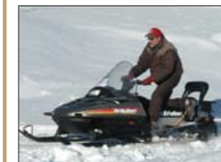
Training mit Motorschlitten „Musher-Kunst“ dank Motorschlitten