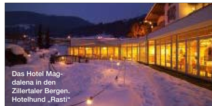
Das Hotel Magdalena in den Zillertaler Bergen. Hotelhund „Rasti“

KONTAKT: Gornergrat-Bahn, Nordstrasse 20, CH-3900 Brig, Tel. 0041 (0)27 9214111, info@gornergrat.ch