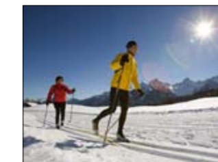
Toller Winterspaß: Langlauf Loipenspaß in Vorarlberg