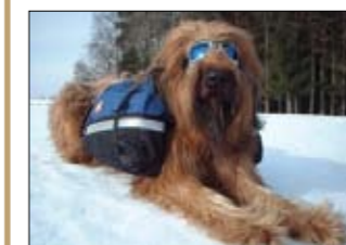
Neu: Hunderucksack „Little Yak“