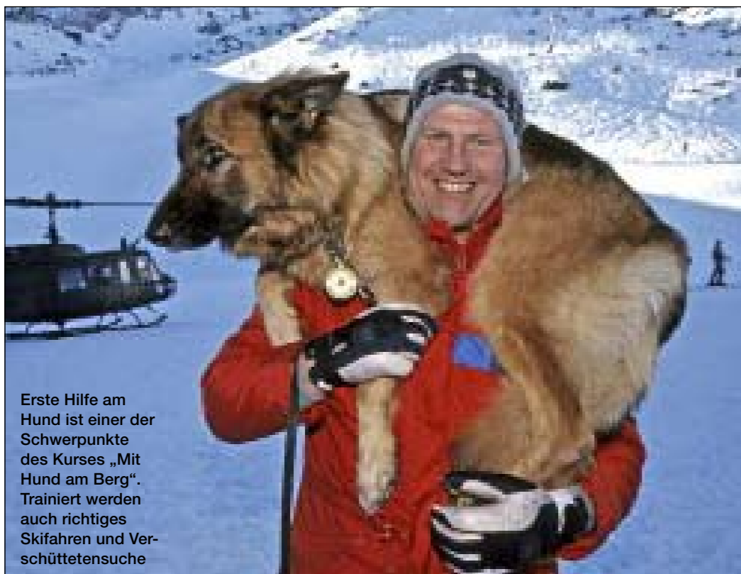
Erste Hilfe am Hund ist einer der Schwerpunkte des Kurses „Mit Hund am Berg“. Trainiert werden auch richtiges Skifahren und Verschüttetensuche